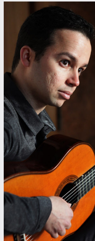
Brasilianische Impressionen gibt es am 16. Juni ab 19.30 Uhr im Rahmen der Reihe „Treffpunkt Solitär: Die Gitarre“ zu hören.

Unter dem Titel „Rundgang 2010“ präsentiert die Abteilung für Bildende