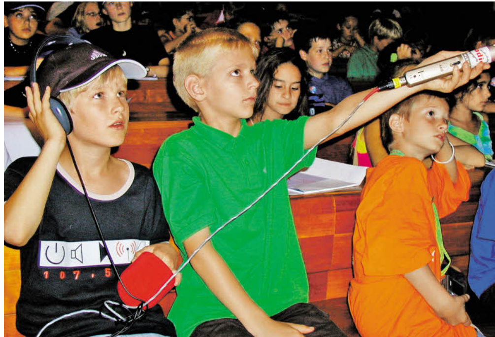
Spannende Welt des Wissens: Die Kinderuni öffnet heuer im Juli für vier Tage ihre Türen.

Die Kinderuni 2010 der Universität Salzburg findet heuer vom 5. bis 8. Juli statt. Wissenschaftler aus allen Teilen der Uni kommen dann im Uni-Gebäude am Rudolfskai 42 zusammen, um zusammen mit Kindern und Jugendlichen die Welt der Wissenschaft zu entdecken.