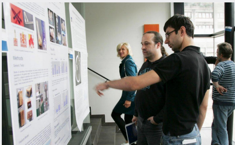
Die PMU lädt am 25. Juni zum „Paracelsus Science Get Together“. Bild: SN/PMU

Mit der „AGIT 2010“ bietet die Naturwissenschaftliche Fakultät der Universität Salzburg von 7. bis 9. Juli viel Raum für Dialoge. Hier treffen visionäre Vordenker und Forscher aus dem Bereich Geoinformatik auf Anwender und wirtschaftliche Akteure. Mehr als 1000 Fachexperten verstehen die „AGIT EXPO“ auch als überregionaler Wirtschaftsmotor in den Bereichen GeoIT, kommunale Dienstleistung, Vermessungswesen sowie Verkehr und Energie.