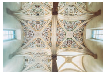
Die Sala Terrena-Decke im Toskanatrakt, einem von mehreren Universitätsstandorten im historischen Altstadt kern von Salzburg.

Vier Leitmotive – Art in Context, Digital Life, Development & Sustainability sowie Health & Mind – unterstützen bei der Entwicklung von übergreifenden Lehr- und Forschungskonzepten sowie dabei, inhaltliche Schwerpunkte der PLUS zu schaffen und zu kommunizieren.