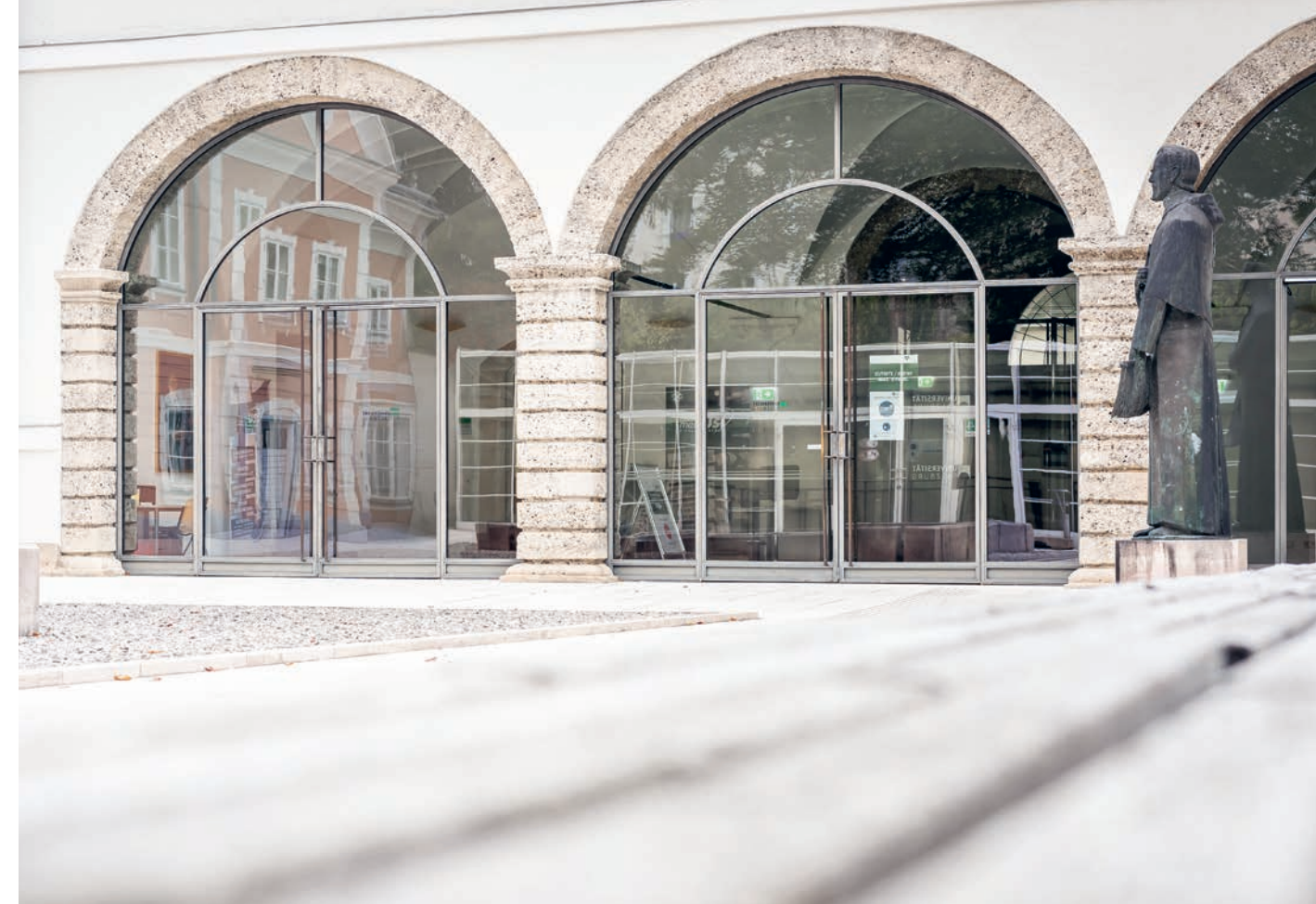
1622 von Fürsterzbischof Paris Lodron gegründet und wiedererrichtet im Jahr 1962, ist die PLUS heute die größte Bildungseinrichtung in Salzburg.