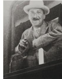
Stefan Zweig in St. Moritz, 1935. Foto: Peer Baedeker

< Umschlag: Stefan Zweig auf der Fahrt von Brasilien nach Argentinien, 1936, © Atrium Press; Verwendung der Fotografie nach Gestaltung durch zunder zwo.