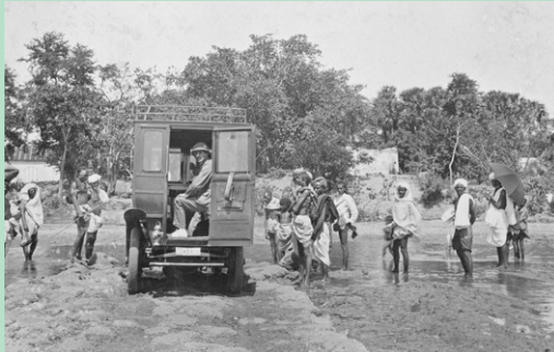
Stefan Zweig während seiner Indienreise, 1908/1909.

zählt bis heute zu den meistgelesenen deutschsprachigen Autor:innen. Zahlreiche Übersetzungen und Bearbeitungen von Europa bis China belegen die anhaltende Strahlkraft seiner Werke. Die Wanderausstellung mit Salzburg als erster Station zeigt Zweig als nicht unumstrittenen Bestsellerautor, als unentwegt Reisenden und als Weltbürger mit pazifistischer Mission. Die Figuren und Schauplätze seiner Erzählliteratur führen ebenso einmal rund um den Globus.