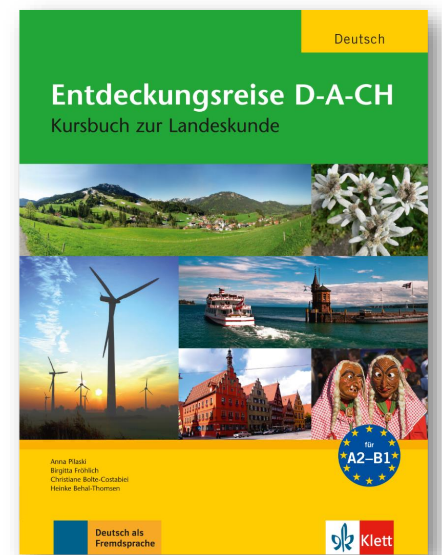
Kursbuch (Klett Verlag)